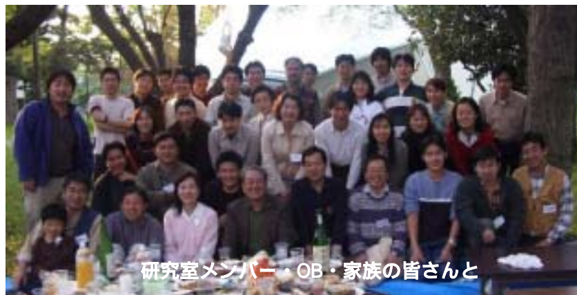
研究室メンバー・OB・家族の皆さんと