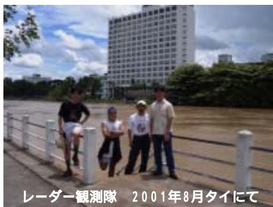
レーダー観測隊 2001年8月タイにて